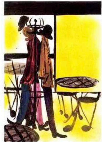
TOMASZ KOWALSKI, SANS TITRE, 2012, TECHNIQUE MIXTE SUR PAPIER, 42 X 30 CM, COLLECTION FLORENCE ET DANIEL GUERLAIN.