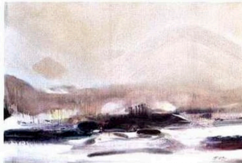
CHU TEH-CHUN, APRÈS LA COUPE DES ADIEUX, LE SILENCE DE LA GRANDE STEPPE, 2001, HUILE SUR TOILE, 130 X 195 CM, COLLECTION PRIVÉE.